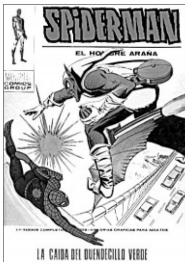
Una de sus míticas portadas.

redit, la británica Fletway y la alemana Bastei, entre muchas otras; pero, sobre todo, pasa a ser el portadista principal de las publicaciones que por aquellos años saca al mercado la editorial barcelonesa Vértice. Entre otros productos, la empresa se encargaba de la presentación en nuestro país del material de la legendaria firma estadounidense Marvel, creadora de personajes tan conocidos como Spiderman, Los 4 Fantásticos, Thor o La